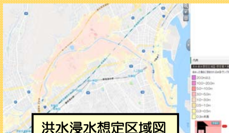
洪水浸水想定区域図

②ここをクリックして地図を「みんなのハザードマップ」「土砂災害情報マップ」「洪水浸水想定区域図」等に切替えます。