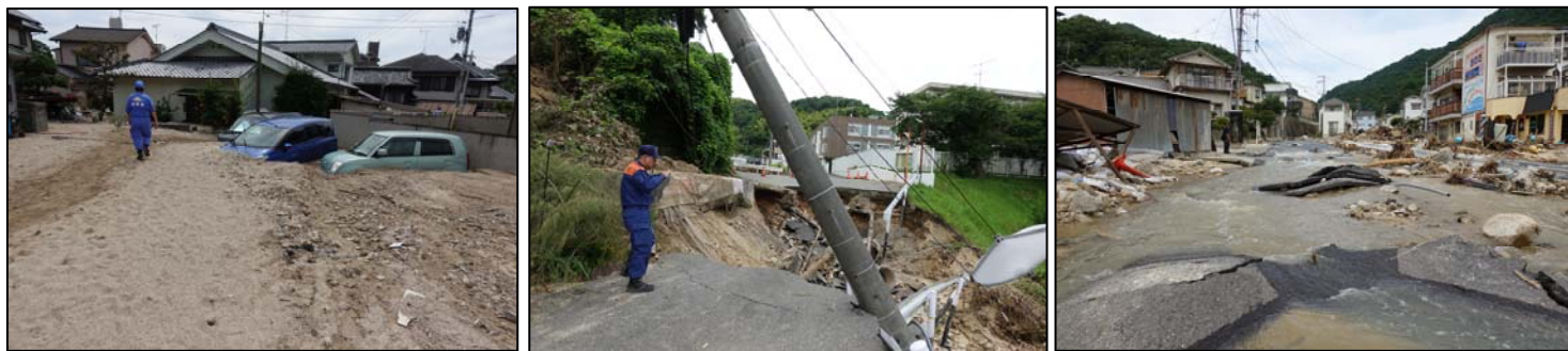
西日本豪雨による広島県の被災状況

7月の西日本豪雨をはじめ、今年も日本各地で記録的な大雨による被害が相次いで発生しています。また台風は8月末の時点で20号を超える勢いで発生しており、これまで以上に風水害対策の重要性が高まってきています。風水害から大切な命を守るために、各家庭・職場で対策に取り組みましょう。