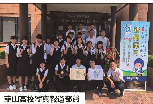
▲葦山高校写真報道部員

取材をさせていただいた企業の方々をはじめ、三島信用金庫の担当の方との協力を得て、紙面製作ができました。この場をお借りして、お礼申し上げます。まだまだ未熟な点も多いですが、地元企業のご様な魅力を知っていただけただけなら幸いです。