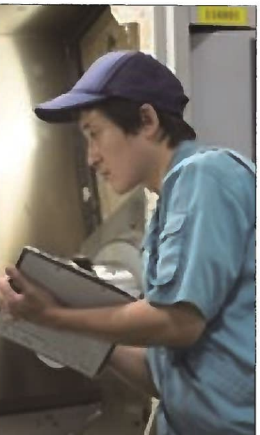
▲作業前の設備点検は 欠かせない

第4号 発行 三島信用金庫 駿東郡長泉下土狩96-3 055-973-5730 制作 県立葦山高等学校写真報道部 日本大学三島高等学校新聞部 県立熱海高等学校報道部 県立沼津東高等学校新聞部 協力 静岡県東部地域局