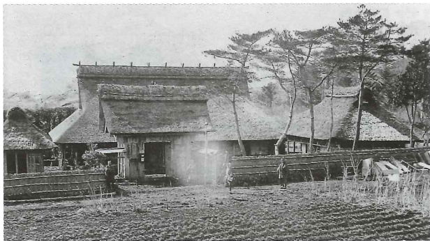
明治時代の赤池家

また、溶岩洞穴「人穴」の上に「大日堂」の建物があったと考えられているが、明治初年の神仏分離令による廃仏毀釈で光保寺（大日堂）は廃され、人穴浅間神社が置かれた。しかし、昭和17年（1942）には人穴が陸軍少年戦車兵学校の演習地となり、周辺住民とともに人穴浅間神社は移転し、昭和29年（1954）現在地に復興した。なお、富士講の衰退もあり、碑塔の建立は昭和39年（1964）以降行われていない。