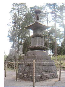
長谷川角行の宝篋印塔