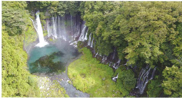
白糸の滝 (平成30年撮影 航空写真)

白糸の滝は、高さ約20メートル、幅約150メートル以上に渡り馬蹄形に広がる崖面の各所から湧出した水が、幾筋もの白い糸を垂らしたように流れ落ち、滝となったものである。白糸の滝周辺の地質は、下部に不透水層である古富士泥流堆積物があり、上部に透水性のある新富士火山の白糸溶岩流がある。富士山麓に降った雨水は、上部の溶岩流を透過し、下部の不透水層との境目を流れ下っていると考えられている。白糸の滝は、両方の層が崖面として露出しており、両方の層の境目や上部の溶岩流の間から水が湧出している様子が確認できる。