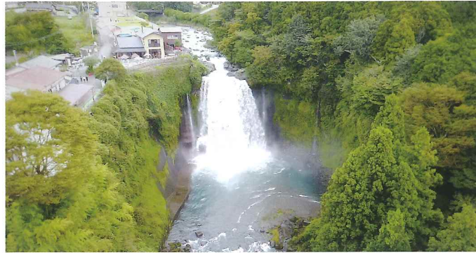
音止の滝（平成30年撮影 航空写真）

音止の滝は、「音無の滝」とも呼ばれ、白糸の滝と台地を隔てた東側に位置する。主瀑は落差約25メートルを流れ落ちる芝川の本流であり、轟音を響かせている。崖面では、白糸の滝同様の地層が観察され、湧水が見られる。