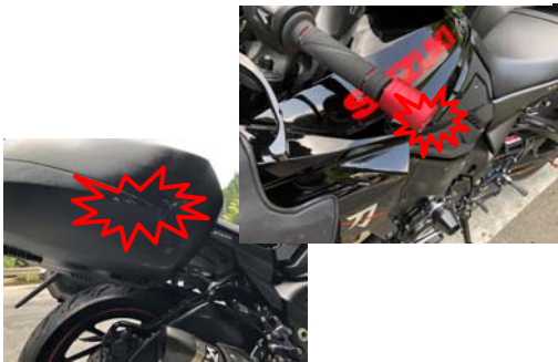
通行車両の破損状況

舗装工事において、交通誘導員の誘導なく工事で交互通行させていた車線を走行した工事車両が対向してきたバイクと接触し、バイクが転倒した。