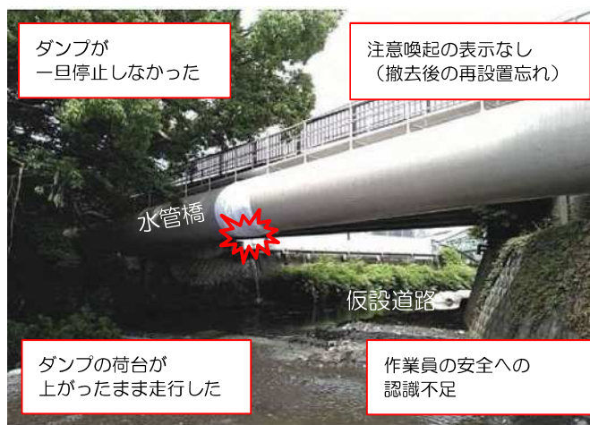
安全対策前の現場状況