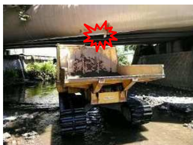
運搬車の接触状況（推定）

河川内仮設道路において、荷台が上がったままの土砂運搬用ダンプが、水道橋の管路に接触した。