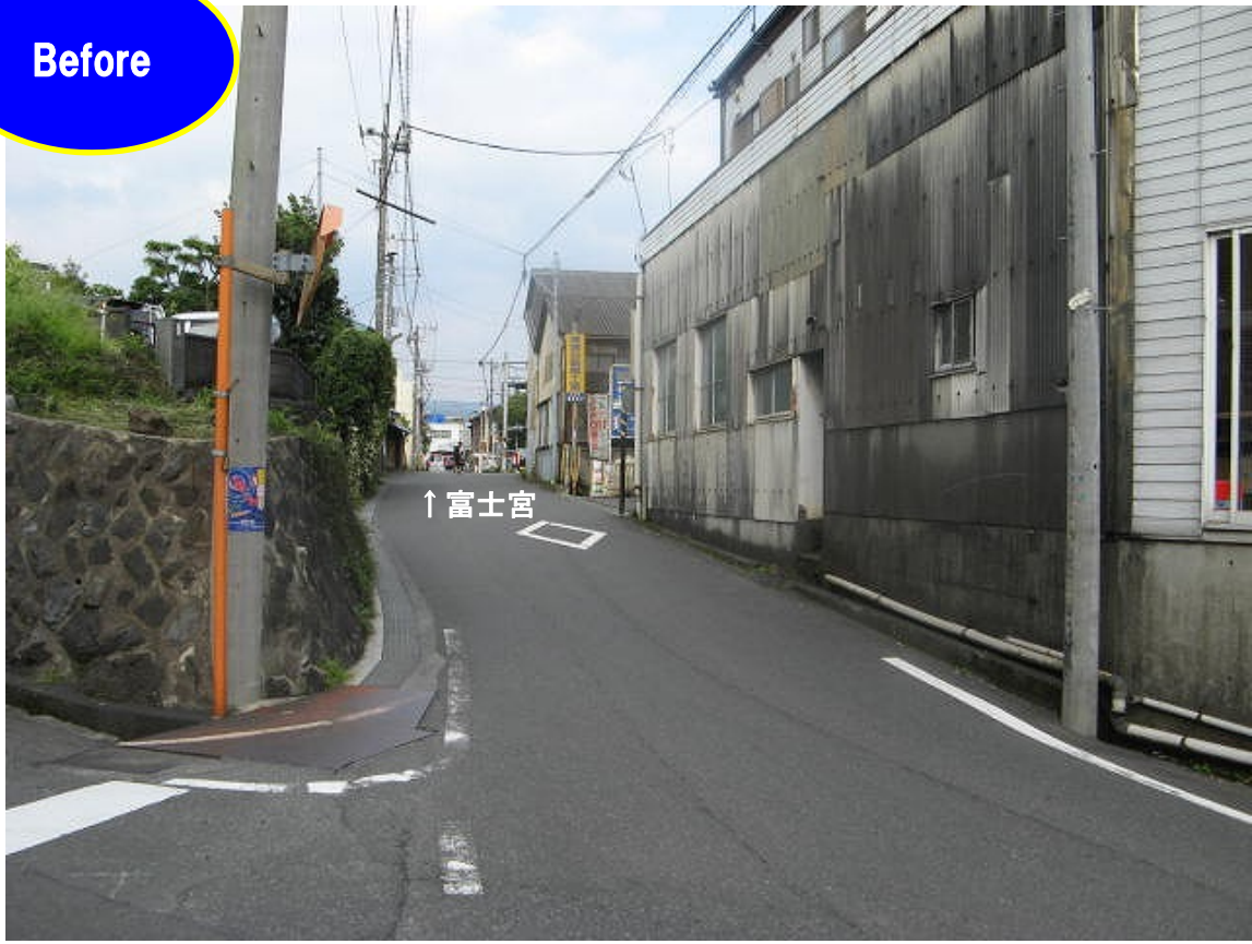
工事着手前 (H24. 9. 12 撮影)