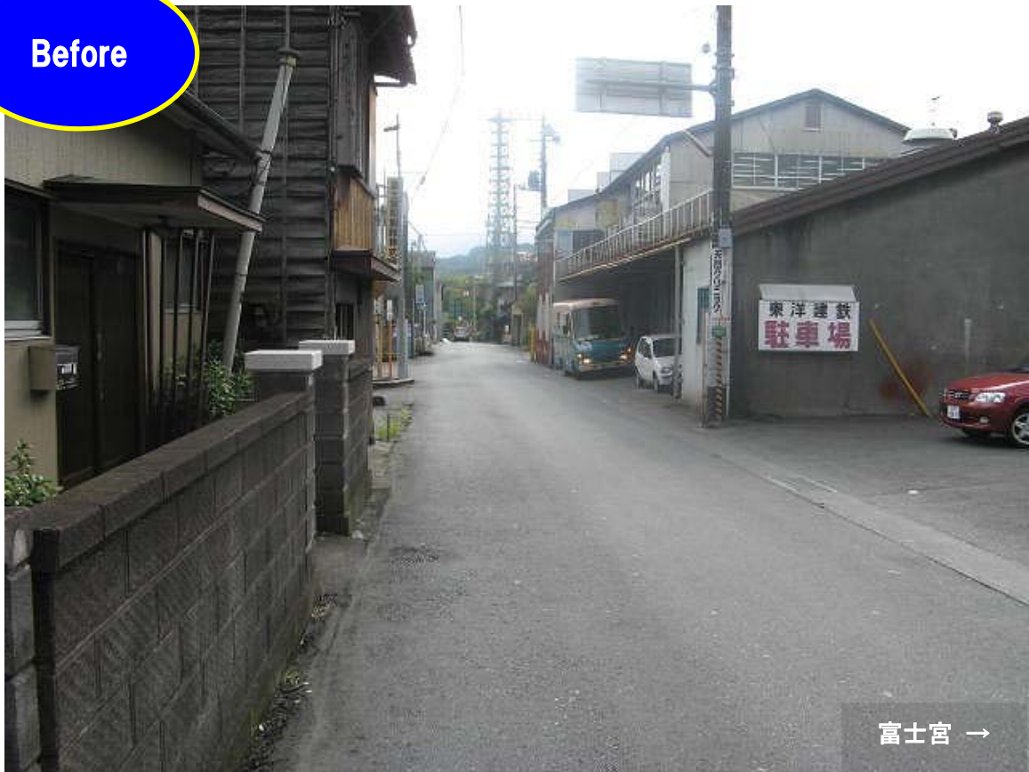
工事着手前 (H24. 9. 12 撮影)