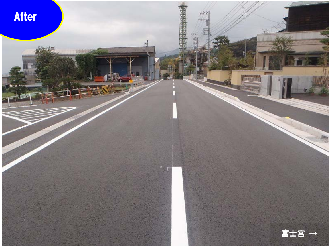
工事完成後 (H28. 10. 5 撮影)