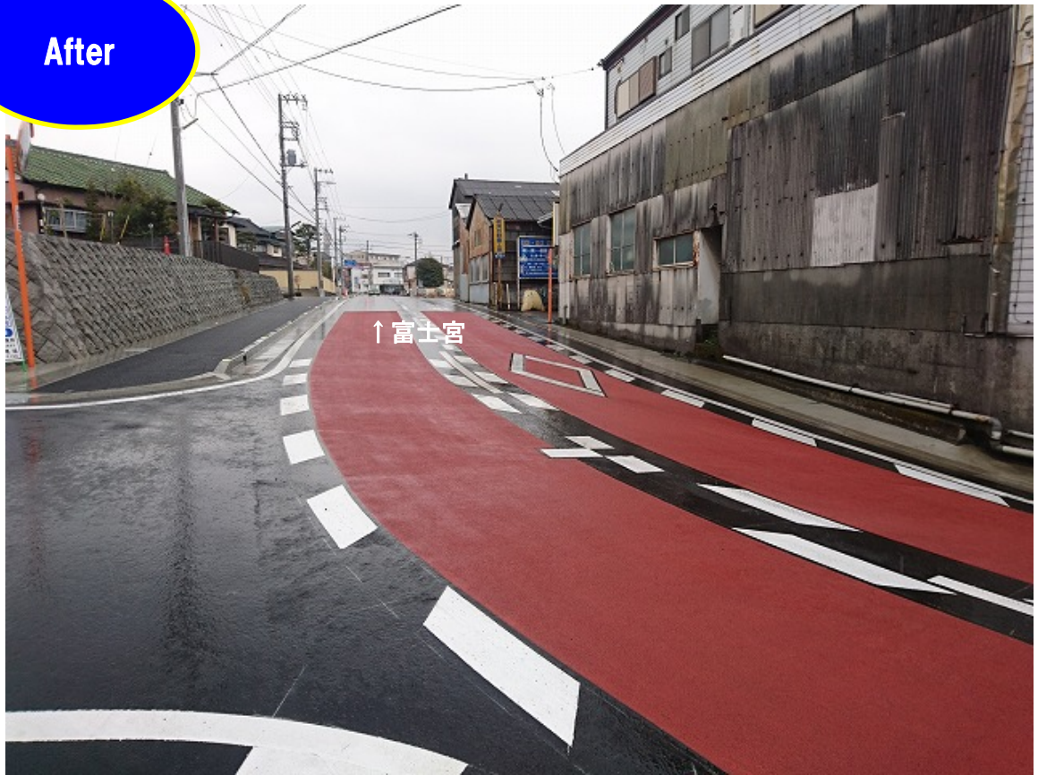
工事完成後 (H29. 3. 6 撮影)