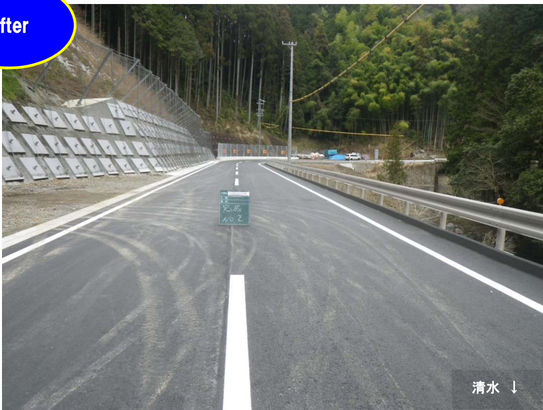
工事完成後（H28. 3. 13 撮影）