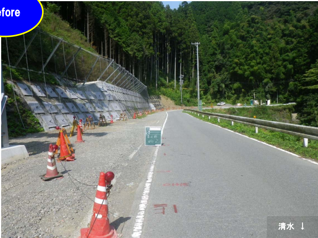
工事着手前（H27. 9. 29 撮影）