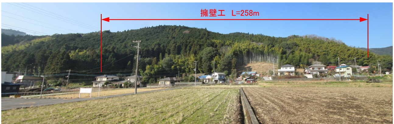
工事施工中 (H29.1.4 撮影)