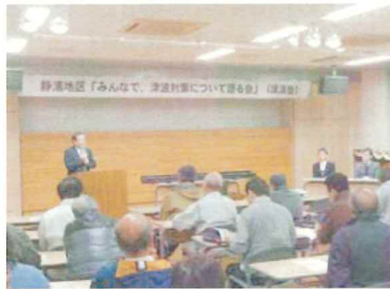
自治会長あいさつ