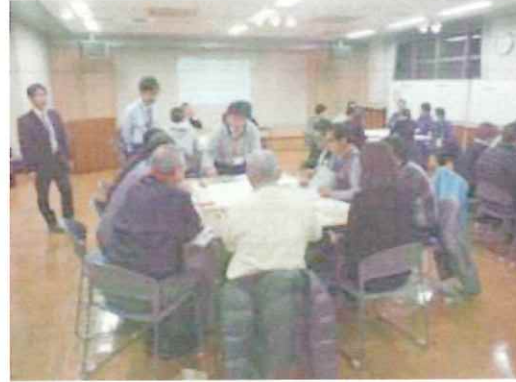
ワークショップ状況①