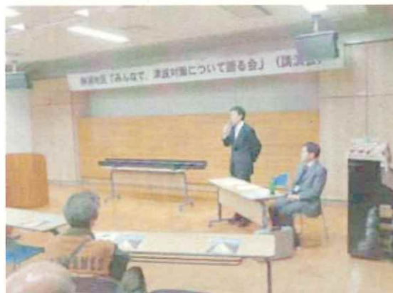
沼津土木事務所長あいさつ