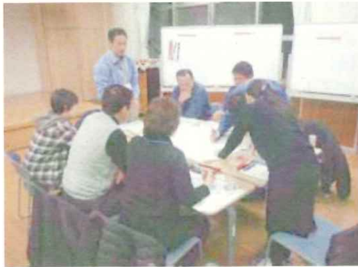
ワークショップ状況②