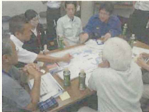
ワークショップ状況①