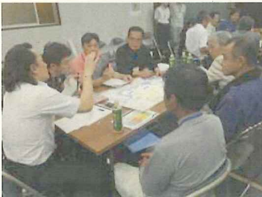
ワークショップ状況②