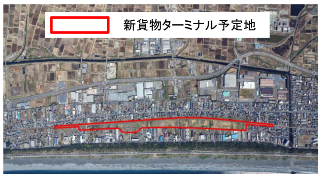
新貨物ターミナル予定地