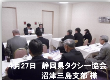
4月27日 静岡県タクシー協会 沼津三島支部 様