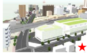
三ツ目ガード付近完成予想図