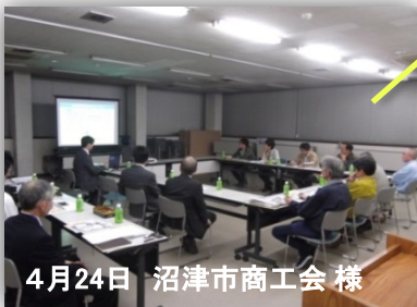
4月24日 沼津市商工会 様