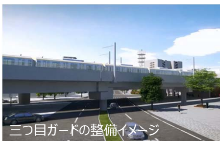
三つ目ガードの整備イメージ

これにより、緊急車両も迅速に通行でき、消防・救急活動などを円滑に行うことが可能となります。