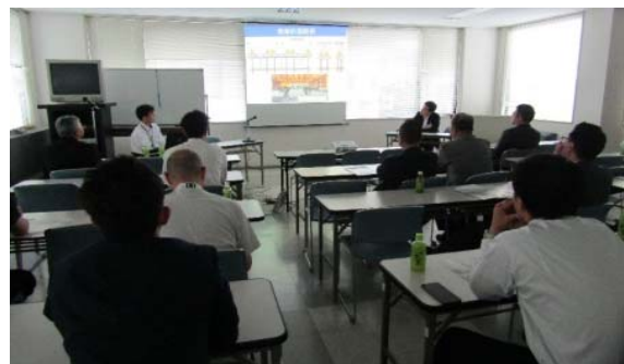
【沼津大手町商店街振興組合】 (平成29年5月26日実施)