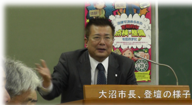
大沼市長、登壇の様子

県と沼津市は、今後も連携を図りながら、鉄道高架事業の工事着手に向けた準備を進めていきます。