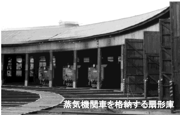
蒸気機関車を格納する扇形庫

沼津機関区の跡地は現在、沼津駅周辺総合整備事業により整備された「プラサヴェルデ」に生まれ変わりました。