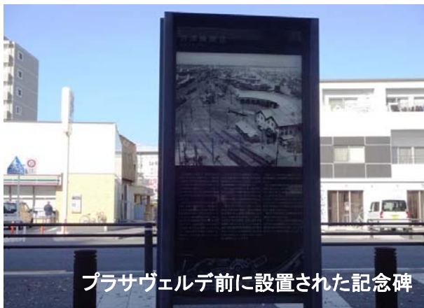
プラサヴェルデ前に設置された記念碑