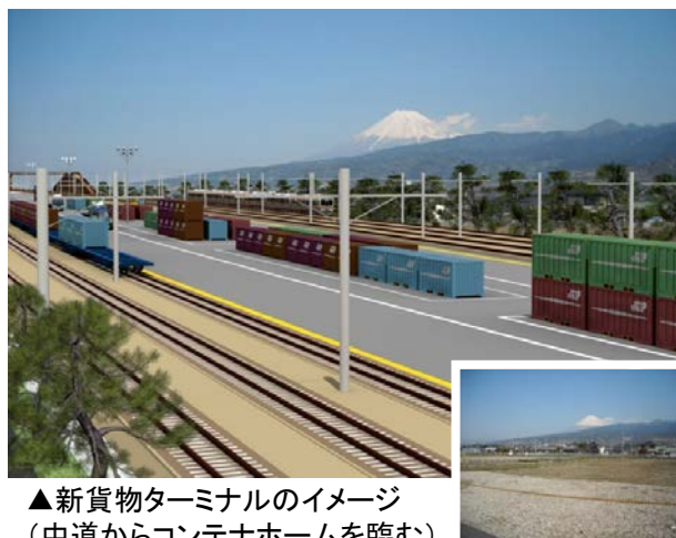
▲新貨物ターミナルのイメージ (中道からコンテナホームを臨む)