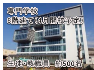
専門学校 8階建て(4月開校予定)