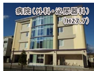
病院(外科・泌尿器科) (H27.7)