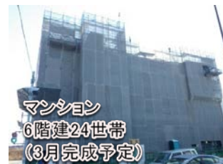
マンション 6階建24世帯 (3月完成予定)