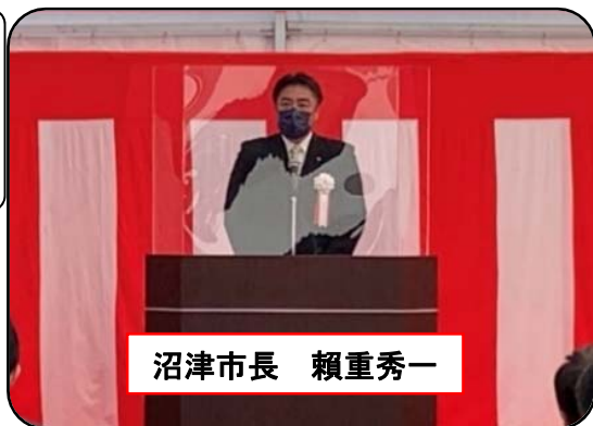
沼津市長 頼重秀一