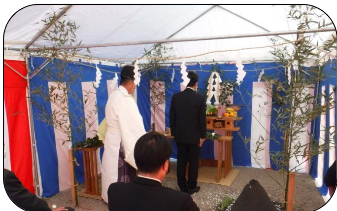
着工式に先立って行われた「地鎮祭」の様子

新貨物ターミナル造成工事・調整池築造工事の着工式を1月14日に開催しました！ 本号では当日の様子(表面)と、今回着工した工事(裏面)についてご紹介します。