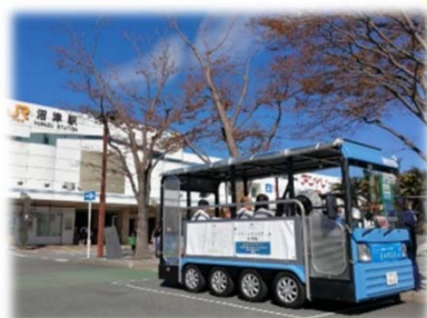
駅と港をつなぐEVバス

異なる魅力を持つ拠点のネットワーク強化が進んでいくことで、中心市街地へのにぎわいのさらなる効果が期待されます。