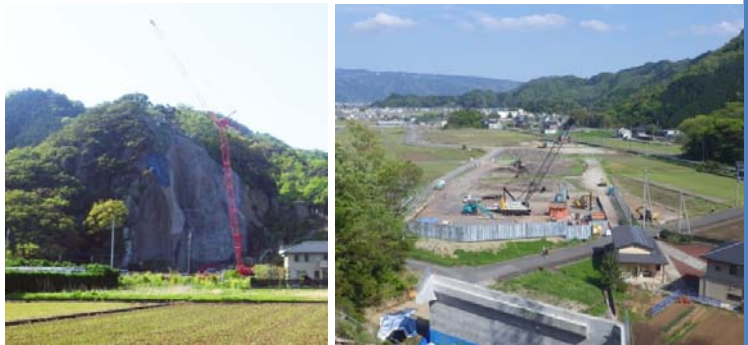
大平側坑口 斜面工事状況