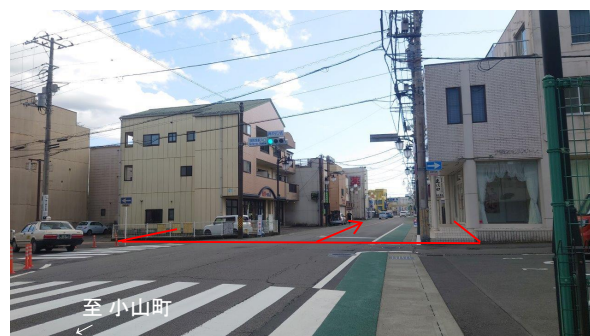
【終点部から起点を望む】