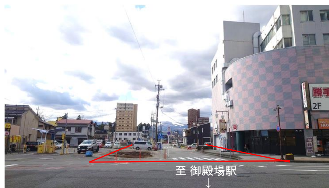
【起点部から終点を望む】