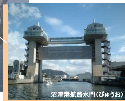
沼津港航路水門(びゅうお)