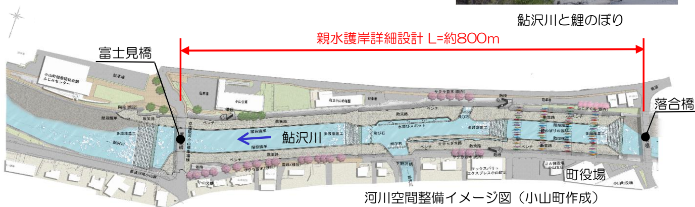
河川空間整備イメージ図（小山町作成）