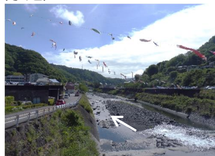
鮎沢川と鯉のぼり