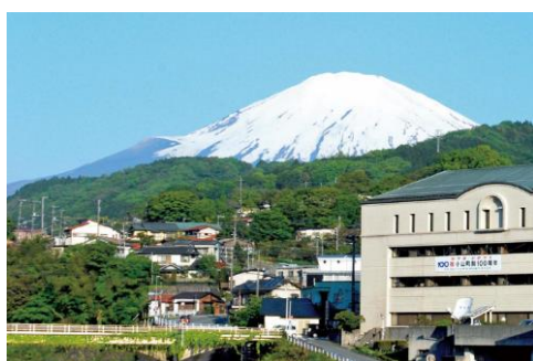
鮎沢川から眺める富士山