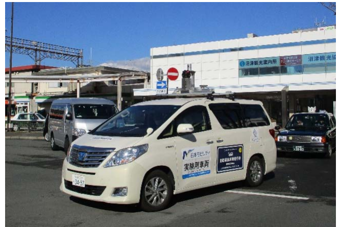
上部にセンサー等を積んだ実験用車両

自動運転の実用化は、ドライバー不足等の公共交通の課題解決に繋がることから、引き続き技術システムの向上に取り組んでいきます。