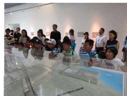
模型の前でまちづくりを勉強

電話での申込となります。(7/10から受付開始) 詳しくは、市推進課まで (055-934-4768)