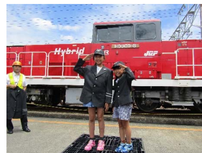
JR貨物の制服を着て記念撮影 写真は、平成29年度の様子です。