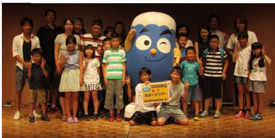
プラサヴェルデでは、「ふじっぴー」がお出迎え！