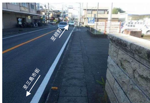
終点部(ウエルシア付近)