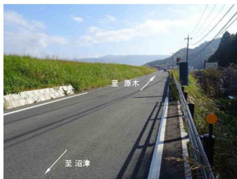
終点部(日守橋付近)