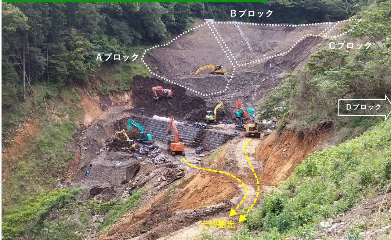
↑ 土砂撤去工事状況（令和5年6月6日）