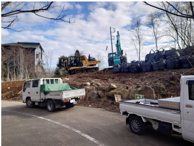
【写真①】 工事用道路施工状況