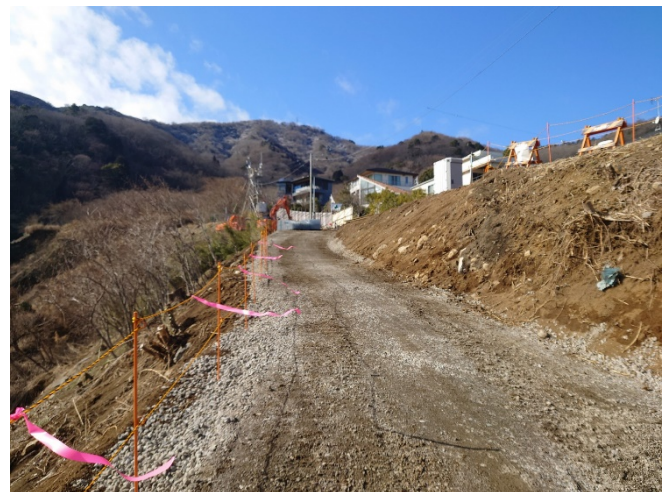
【写真②】 工事用道路（施工中）