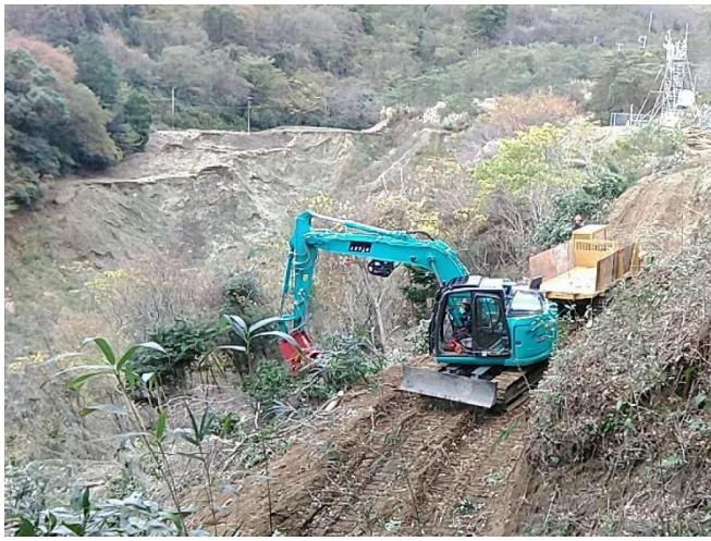
【写真①】 伐採作業の状況