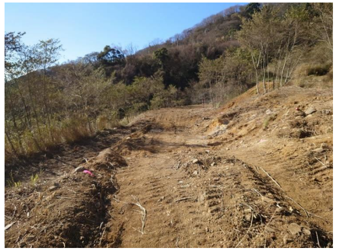
【写真②】 伐採後の状況