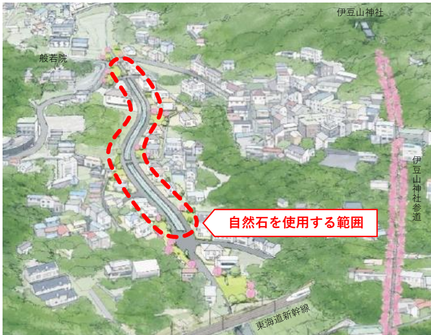
上空から望む整備イメージ（鳥瞰） ※熱海市伊豆山復興まちづくり計画に加筆

このため、逢初川の護岸材料について逢初川周辺の方々に意見を伺ったところ、護岸には自然石がふさわしいとの声が多かったことから、県では護岸整備に自然石を使用することにいたしました。なお、整備区間は急勾配で水の流れるが速いため、自然石の裏にコンクリートを施工することで大雨にも耐えることができる構造にします。