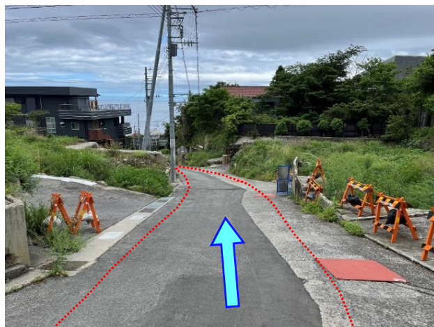
上流側（終点）から下流側を撮影