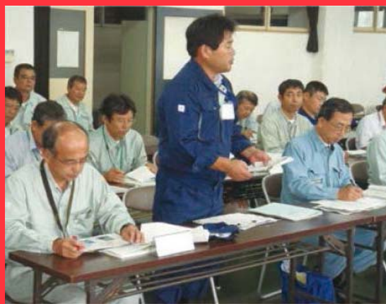
気象状況の解説・助言