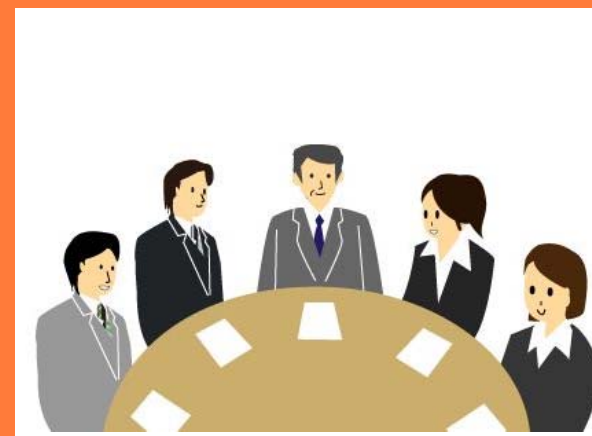
災害対応について関係者で振り返り