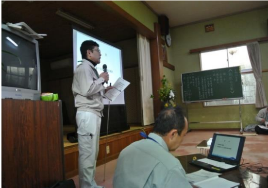
第 1 回地区協議会風景