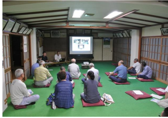
第 2 回地区協議会風景