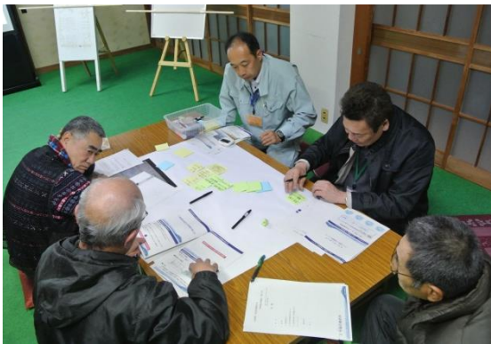
第 3 回地区協議会風景