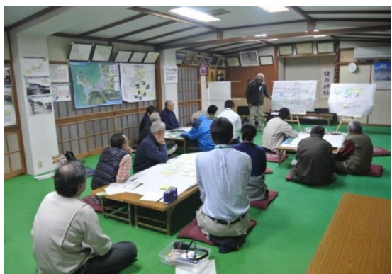
第 4 回地区協議会風景