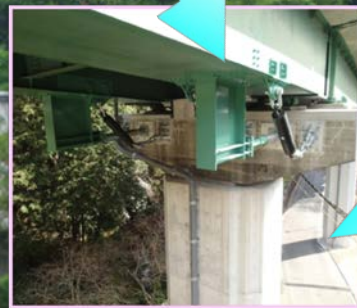
チェーンによって落橋を防止します！ また、橋脚を補強することで地震に強くしています！