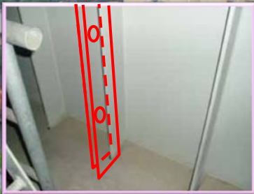
鋼製の橋脚も内部から補強します！