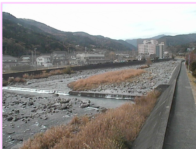
↑↑カメラから見える様子(東伊豆町白田川)