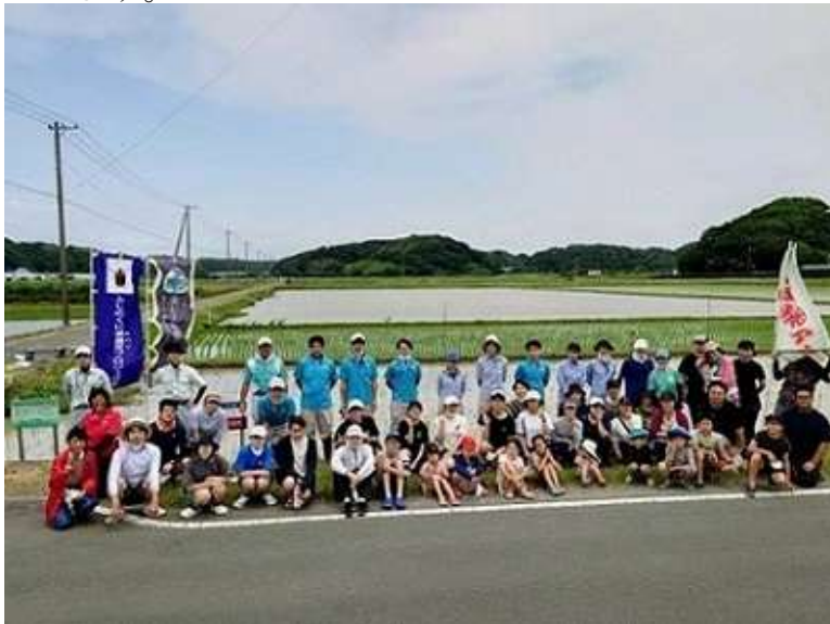
田んぼアートの田植え参加者（総勢60名）（令和4年6月19日撮影）

毎年12月15日に行われていた雄踏町と周辺のまちに伝わる風習です。田畑を荒らす害獣を食べるキツネを守護神としています。当日は、キツネ（守護神）に扮した子供たちが「すココンおくれ すココンコン」と唱えながら、お供え物の「おもっそ（小さく握った赤飯）」を取りに行き、五穀豊穡や商売繁盛を祈りました。50年の時を経て2009年から現代風変わった「すココン祭り」は、毎年12月に開催されています。