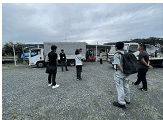
（機械・資材見学の様子）