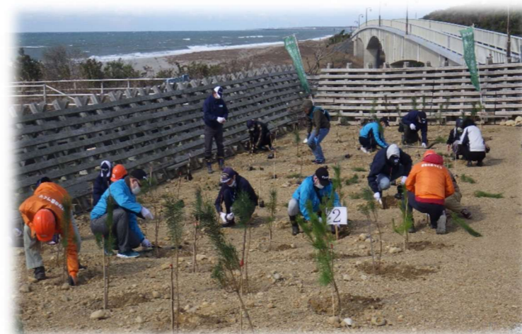
けんみん さんか さんか かいがんりん かいがんりん さいせいび さいせいび かけがわし かけがわし しよくじゆさい しよくじゆさい 県民参加による海岸林再整備(掛川市植樹祭)

しずおかけん ちゆうえん ちゆうえん のうりん のうりん じむしょ じむしょ 静岡県中遠農林事務所