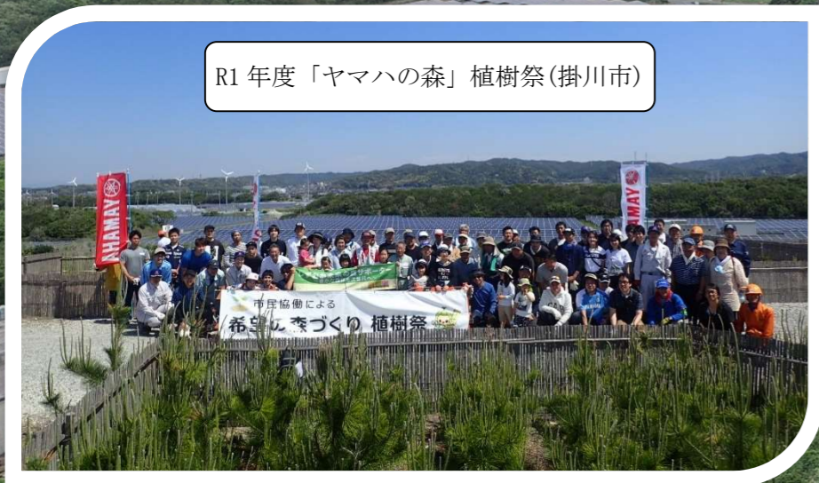
R1年度「ヤマハの森」植樹祭(掛川市)

まも かいがん かいがん ぼうさいりん ぼうさいりん さいせいび さいせいび ~くらしを守る海岸防災林の再整備~