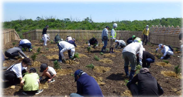
けんみんさんか かいがんりんさいせいび ふくろいししょくじゆさい 県民参加による海岸林再整備(袋井市植樹祭)

もり ぼうちようてい とりくみ まも かいがん ぼうさいりん さいせいび ～くらしを守る海岸防災林の再整備～