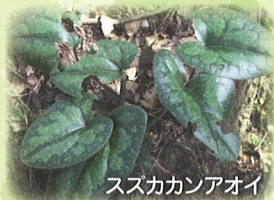
ススカカンアオイ