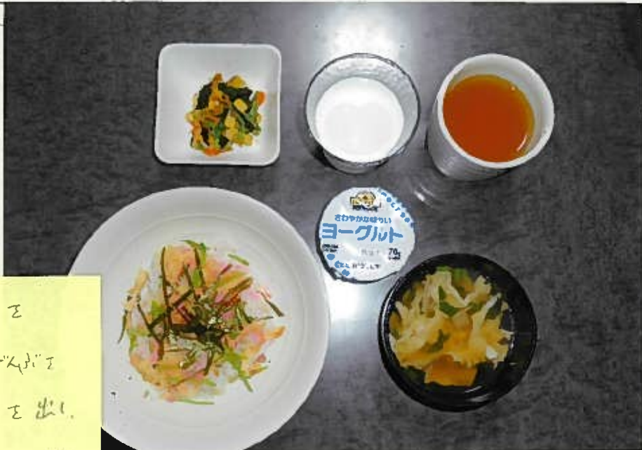
2. 部分の写真 2枚まで ※説明を付してください

ちらし寿司は特に色合いを 工夫しました。卵・絹・餅でムギイ 便で黄色・緑色、ピンクを出し、 色鮮やかにしました。小さい子でも 食べられるようにと、中に入っている 野菜は小さく切ったとろろを