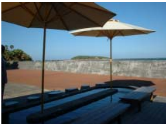
青島を望みながらのデイサービス