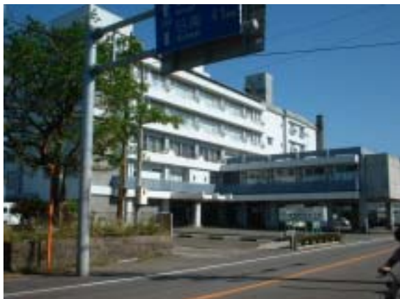
海岸に面したリゾートホテルの青島観光ホテル

説明会で紹介した事例のひとつです（全国に先駆けてデイサービスを実施した宮崎市の青島観光ホテル）