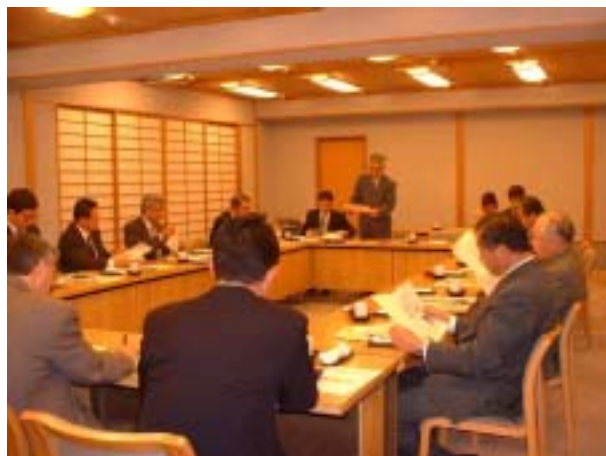
熱海温泉ホテル旅館協同組合での説明会

静岡県ホテル旅館生活衛生同業組合 熱海温泉ホテル旅館協同組合 伊東温泉旅館ホテル協同組合 特定非営利活動法人エイミック 熱海市 伊東市 静岡県熱海県行政センター 静岡県熱海健康福祉センター・保健所