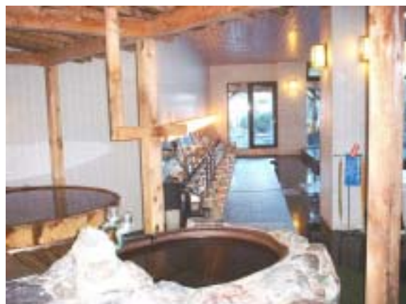
入浴はホテルの浴場でゆったりと