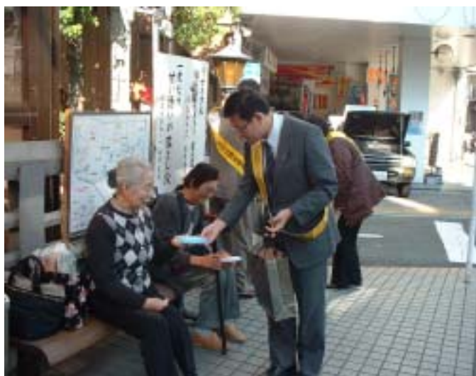
セイフー熱海店前での街頭キャンペーン

障害のある方の福祉の向上を図るため、12月3日から9日の間、障害者週間が実施されました。