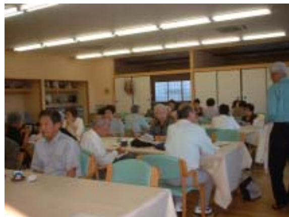
多目的ホールを改装した広々とした部屋で