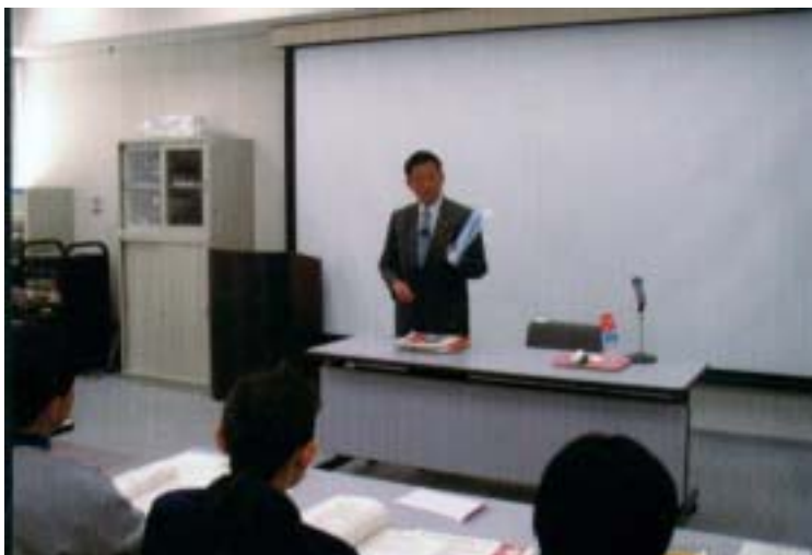
11月29日の長野市での講演の様子。大阪での講演も予定されています。

人工呼吸器を装着している方、在宅酸素療法をしている方、人工透析を受けている方、移動が困難な方、特殊な薬剤を使っている方