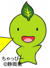
ちやっぴー