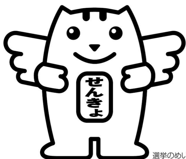
選挙のめいすいくん