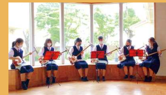
静岡県立湖西高等学校 教養部三味線班 (湖西市)

県内公立高校で唯一の三味線部(長唄三味線)。老人ホームや、地域のイベントで演奏を行っている。日本文化の伝統や格式を重んじながら日々の練習に取り組み、演奏を通して三味線の素晴らしさを伝えながら、地域との連携を図っている。