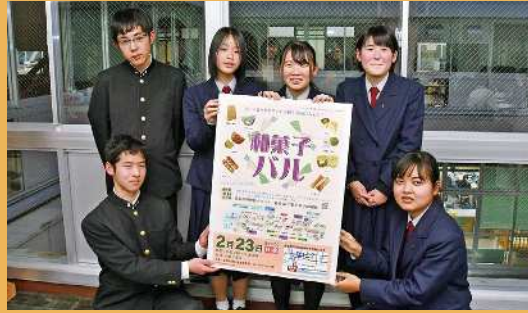
静岡県立島田商業高等学校 珠算部 (島田市)

授業で学んだ商業の知識を活かし、「地域の若者による地方創生のアイデアの実現」に向けたイベントを実施。「和菓子パル」では生徒自ら商店街を訪問。地域の現状と課題を把握しながら、その企画・運営を通じて地域づくりに貢献している。