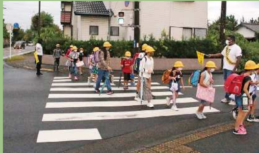
子供の安全を守る会 (磐田市)

平成17年から、毎日福田小学校の登下校における子供の安全を見守る活動を続けている。この活動を続けてきたことで、これまで大きな事故や怪我が発生したことはなく、児童の安全な登下校に貢献している。