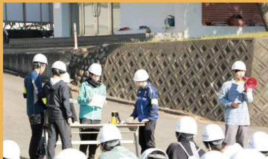
沼津高専寮学生会防災担当 (沼津市)

地域の自主防災役員との避難所運営会議に毎回出席し、若者の立場から意見・アイデアを出している。また、地域防災訓練の際には、会場の設営、地域住民の案内・誘導を行うなど、地域防災に貢献している。