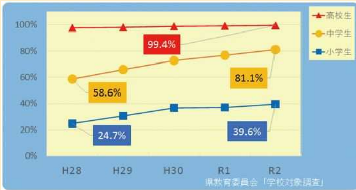
静岡県教育委員会 学校対象調査 (令和2年度末実施)より