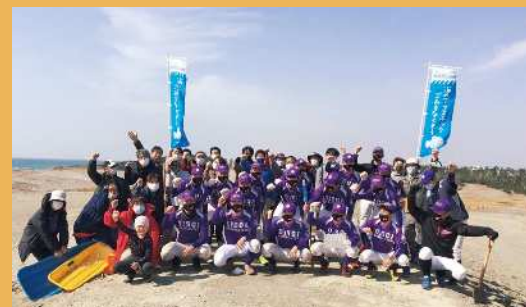
学校法人中野学園 オイスカ高等学校 (浜松市西区)

市民団体、企業、行政、他校と連携し「浜と松プロジェクト」に取り組み、中田島砂丘や松の保全活動、海岸の生態系影響調査等を行っている。さらに、卒業生が市民団体を立ち上げて活動を継続させるなど、環境保全の輪を広げている。