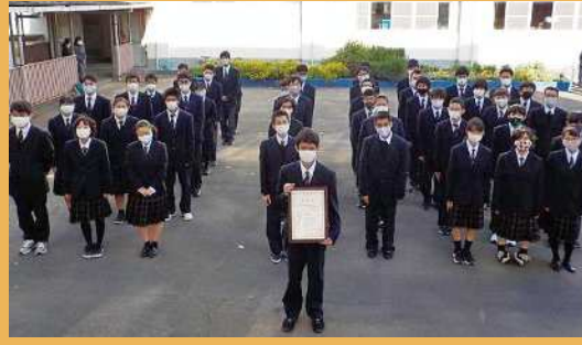
静岡県立沼津特別支援学校 愛鷹分校 (沼津市)

地域の祭りに参加し、作業学習で作製した製品の販売や、市が主催する地域との交流では体操教室の補助等を行った。また、地域と一緒に防災学習を行うなど、積極的に地域行事に参加し、共生の地域社会づくりに貢献している。