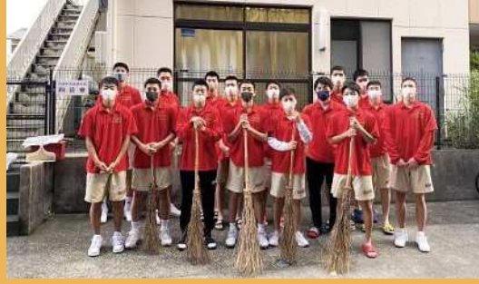
沼津中央高等学校男子バスケットボール部 向岳寮生 (沼津市)

平成24年から、毎週日曜日に寮周辺の地域清掃を実施。地域からも応援される部となることを目指し、部員が自発的に始めた活動が、代々先輩から後輩へ受け継がれている。地域貢献に力を入れている姿は、地域の方々から高く評価されている。