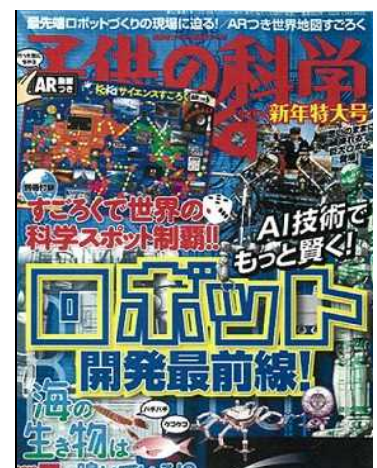
『子供の科学 2019年1月号』 誠文堂新光社