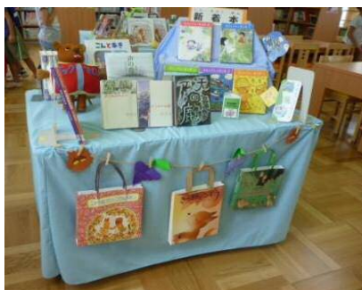
【改造計画や作業スケジュール、ディスプレイの仕方など、学校のニーズに合わせて支援します】