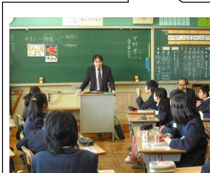
【指導案等資料の提供、授業展開や評価に関する助言を行います】