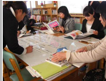
【学校図書館を活用した授業の構想や調べ学習の仕方等日々の実践に役立つ演習を交えた研修を行います】