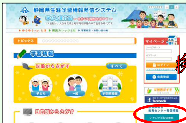
【静岡県生涯学習情報発信システム】