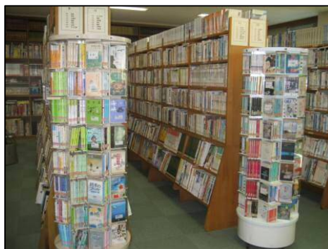
【充実した所蔵の学校図書館】

さらに、長期休業中は貸出無制限を行っており、抱えるほどの本を借りて読書に親しむ生徒の様子が見られるということです。