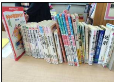
【授業で活用した図書資料】