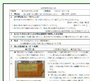
【公開授業のまとめ】