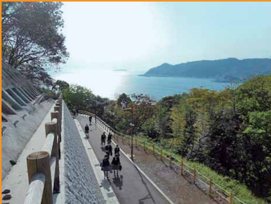
(写真は、「さくらの名所散策路」(熱海高校の通学路)平成29年3月開通)

「平成30年度公立高校をめざすあなたへⅡ」は、静岡県教育委員会高校教育課のホームページ ( http://www.pref.shizuoka.jp/kyouiku/kk-050a/index.html ) に掲載しています。