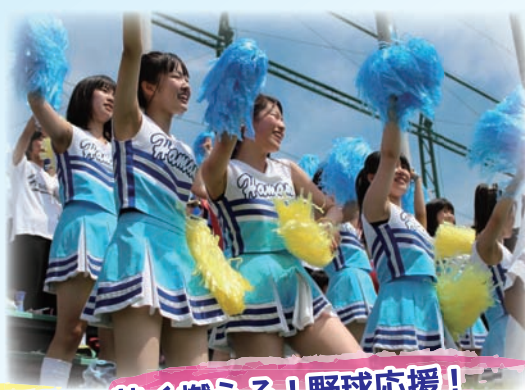
文化祭、体育祭は個性爆発