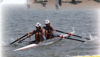
高校にしかない部活動も！